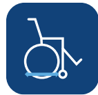
Totallängd utan benstöd ▼