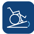
Max lutning vid användning av parkerings- broms ▼