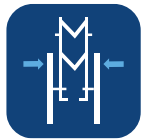
Totalbredd ihop- fälld ▼