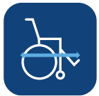
Totallängd inkl benstöd ▼