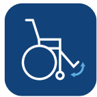
Benstöds- vinkel ▼